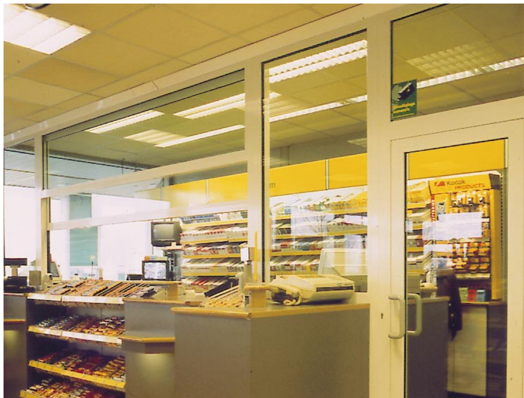
Bescherming tegen gewapende aanvallen.