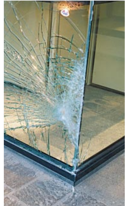
Winkeletalage na inbraakpoging met een wagen.