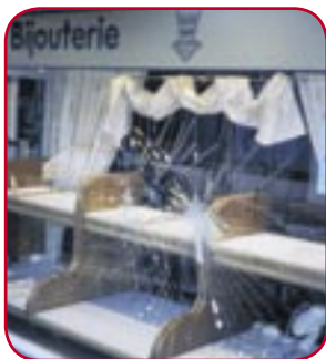
Beveiligingsglas beschermt zowel u als uw kostbare eigendommen tegen inbraak en vandalisme.